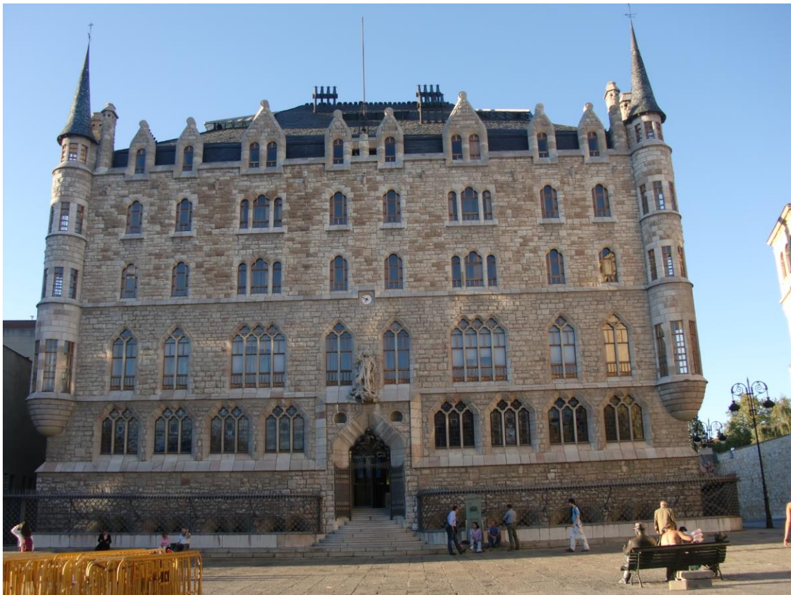
Casa Botines, Leon

A Leon, on peut voir la Casa Botines. Aujourd'hui, c'est le siège social de la banque Caja Espana. A l'occasion, il y a des expositions. Si c'est le cas, le pèlerin peut encore mieux admirer cet œuvre de Gaudi sinon il faudra se contenter de prendre des photos de l'extérieur.