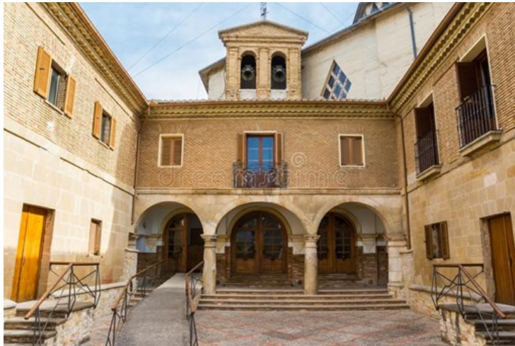
Photo de l'église 398 Estella Espagne Photos libres de droits et gratuites de Dreamstime

Dans les temps anciens (vers 1085), les bergers afin de se défendre et protéger leurs troupeaux des animaux sauvages et de bandits qui rôdaient. Selon la légende, une nuit les bergers étaient rassemblés dans la région que l'on connaît maintenant comme Estella, ils observèrent une pluie d'étoiles filantes hors de l'ordinaire sur le sommet de la montagne. Curieux, ils allèrent voir ce qui se passait. Quelle ne fût leur surprise en découvrant une statue de la Vierge Marie dans une grotte. Ils décidèrent de rapporter la statue dans une église locale pour la protéger. À leurs grandes surprises, malgré tous leurs efforts, la statue ne bougea pas. Devant un tel miracle, on décida de construire une chapelle pour protéger la statue et on appela l'endroit « Estella » qui signifie étoile.