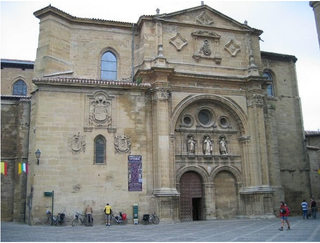
Cathédrale de Santo Domingo de la Calzada