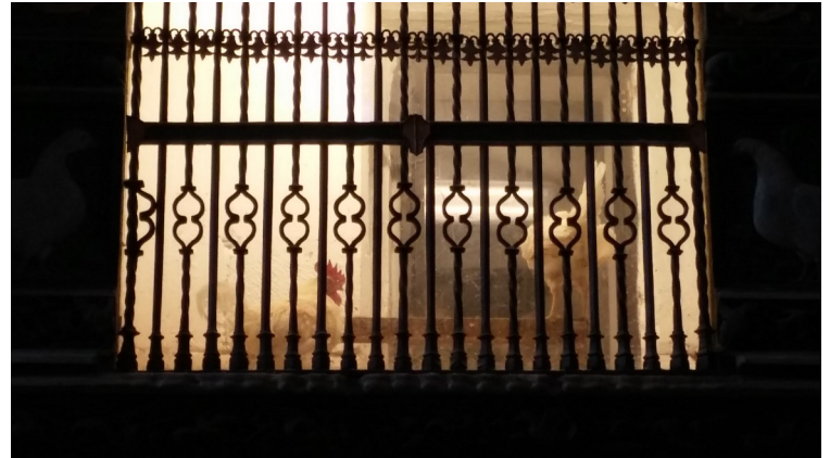
Poulailler dans la cathédrale

Ref : http://www.english.catedralsantodomingo.es/santo_domingo.html