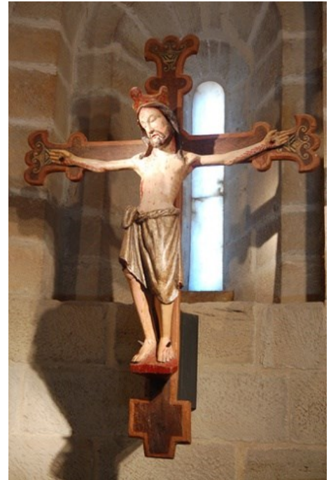
St Christ des Chevaliers du Sépulcre

Cette chapelle est construite sur un plan octogonal selon la tradition du Saint Sépulcre. Elle est surmontée d'une énorme lanterne qui pouvait servir à guider les pèlerins la nuit ou dans le mauvais temps.