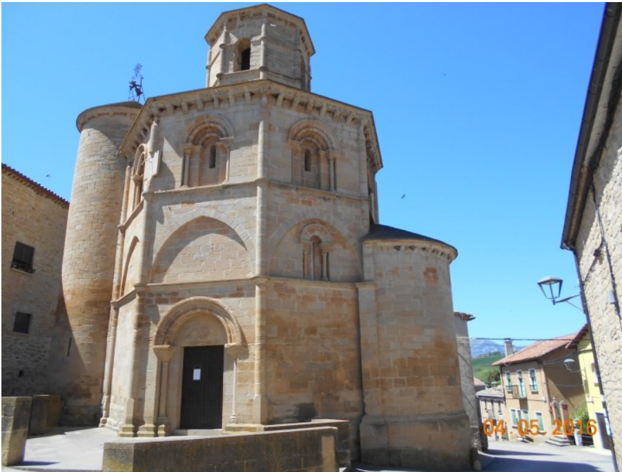
L'église du Saint-Sépulcre de Torres del Río