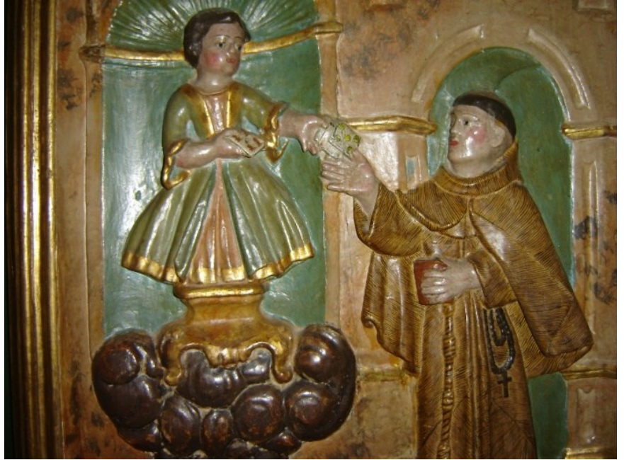
Saint Antoine et Jésus