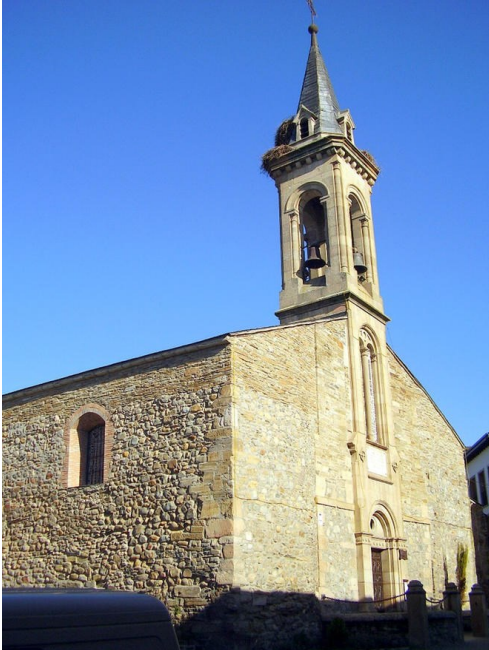
Église Quita Angustia