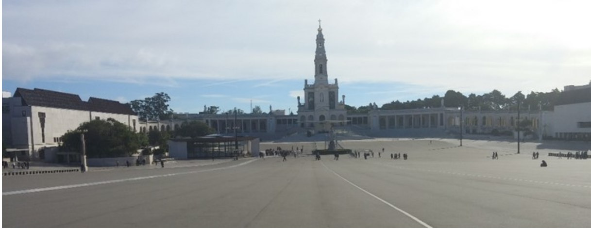
La place centrale devant l'église Notre-Dame-de-Fatima