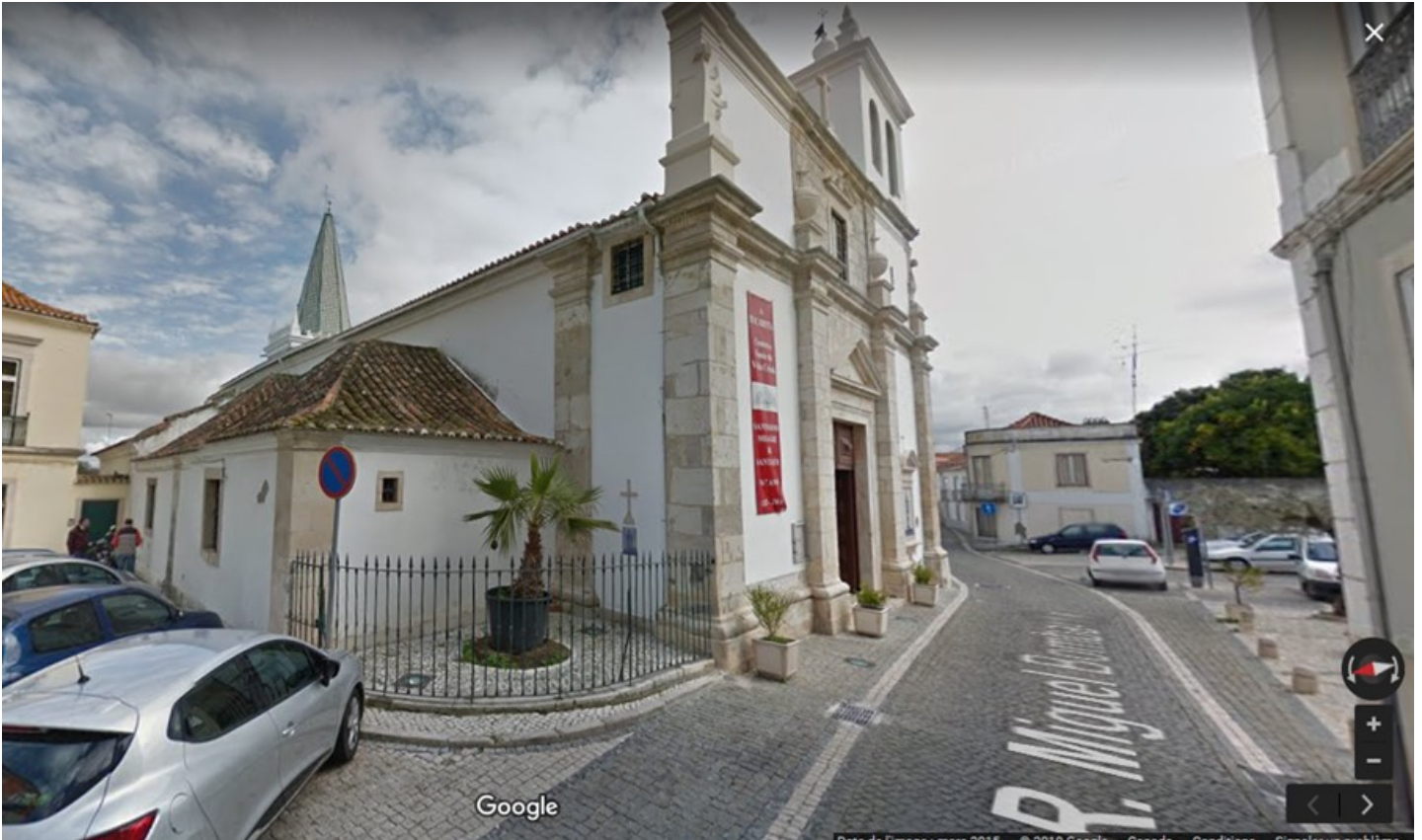
Iglesia del Santísimo Milagro (Église de Saint-Étienne) Rua Braamcamp Freire, 2000 Santarém