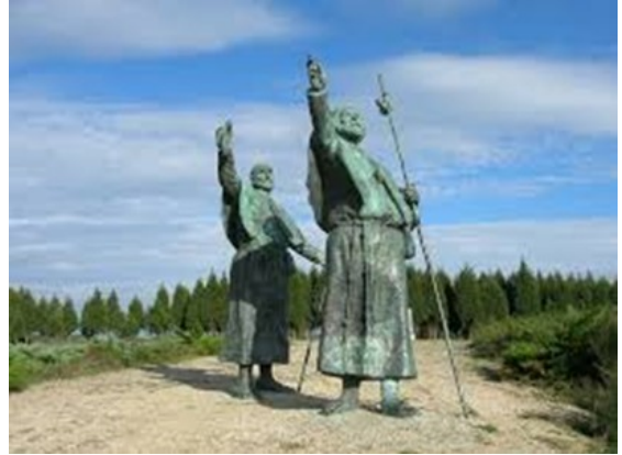
Photo # 2 Statues de pèlerins regardant Santiago Monte do Gozo - Monumento al peregrino.

Ceci peut être votre dernière étape avant d'arriver à Santiago. Cet emplacement renferme plusieurs symboles importants. Son nom, Monte do Gozo, est dérivé de l'expression de joie des pèlerins qui, en arrivant, découvraient pour la première fois la ville de Santiago et surtout les clochers de la cathédrale. Selon l'histoire, en voyant ce spectacle, les pèlerins français s'écriaient « Mon joie » qui a pris la forme de « Monte do Gozo » que l'on traduit par « Colline de la joie ». De nos jours, une forêt d'eucalyptus cache cette vue. Pour ceux qui veulent voir la vision qu'avaient les anciens pèlerins, il faut faire un détour pour rendre visite aux statues de deux pèlerins (photo # 2) qui regardent Santiago. Voir le YouTube : https://www.youtube.com/watch?time_continue=39&v=1nZSOILHL7c&feature=emb_title