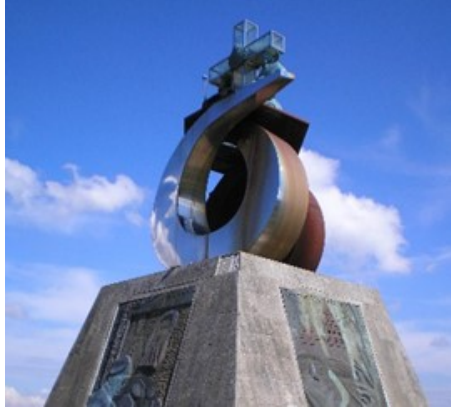
Photo # 1 Monument pour la visite de Jean-Paul II.