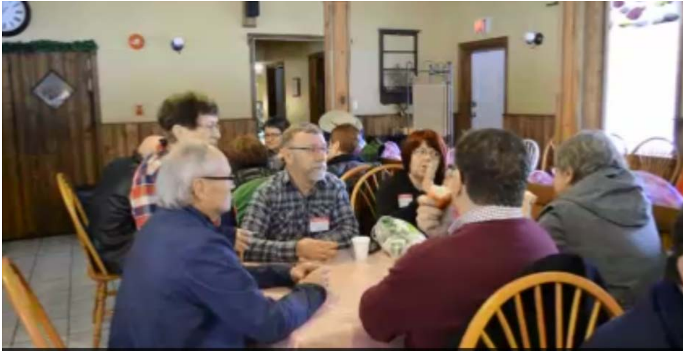
On partage le pain et les expériences