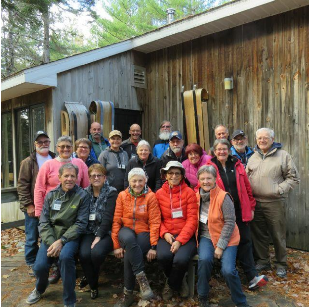
Les braves du camino Kouchibougouac

Une méchante surprise attendait nos pèlerins à leur réveil, le matin de la rencontre. Dehors, un